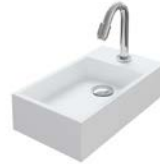
SOLID SURFACE 400 MM