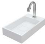
MINERALGUSS 400 MM