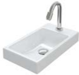
KERAMIK 400 MM

2 BREITEN | 4 WASCHBECKEN | 3 AUFBAUBECKEN