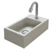
BETONBECKEN 400 MM